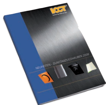
Ganz oben: Die Wandhauben „Mini OM colours“ sind in vielen aktuellen Trendfarben erhältlich. Mit ihrer Form als Kreis im Quadrat setzen sie in jeder Küche neue Akzente. Oben: Lust auf mehr? Alle Neuheiten sind im Dunstabzugshauben-Katalog des Elica Premium-Vertriebspartners Horst Vogt aufgelistet und detailliert beschrieben.

Neben der Leistungsfähigkeit stehen bei den Hauben aber auch Benutzerfreundlichkeit, Pflegeleichtigkeit sowie Design, Material und Optik im Vordergrund. In Edelstahl oder Glas, Schwarz oder Weiß, oder wie die „Mini OM colours“ verfügbar in vielen Trendfarben: Vogt bietet in seinem Katalog mehr als 70 exklusive Dunstabzugshauben-Modelle an.