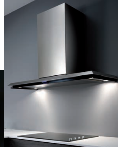
Unten: Durch „EDS3“ versprechen die Modelle „Solaris“ (o.) und „Space“ (l.) wesentlich leiser zu sein als herkömmliche Hauben.