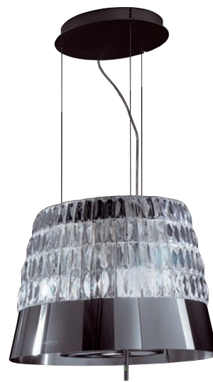
Oben: Durch das schimmernde Kristall-Glas von „Victoria“ wird Licht reflektiert. Mitte: Die „Ola Bright & Red“ imponiert durch ihre raffinierte Bicolor-Optik.

Horst Vogt GmbH: Technische Highlights und exklusives Design