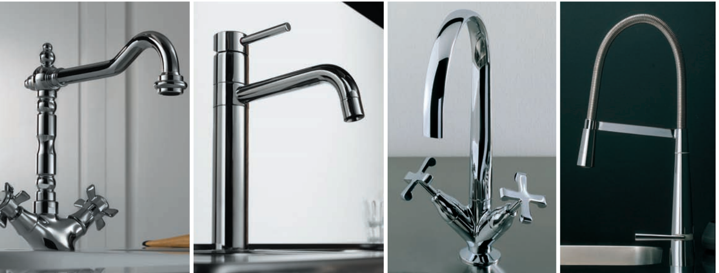
Oben: Die neue Armaturen-Linie „Vogtwelt“ überzeugt mit Vielseitigkeit. Von links nach rechts: „Ritz“ im nostalgischen Look, „OZ-2“ – puristisch schön, „Carlos Primero“ in klassischer Form und „Lilikid 300“ ganz modern.

Zubehörspezialist Vogt bringt die Küche zum Leuchten und stellt neue, energiesparende Lichtkonzepte für verschiedenste Einsatzorte vor. Wie zum Beispiel „Cult“ mit 78 Leuchtdioden (oberes Foto). Ebenfalls ein Blickfang: „LED Q 84“ in superflachem Design (darunter). Praktisch und dezent zugleich: „Filou“ – sie lässt sich zu Lichtbändern montieren (unten rechts).