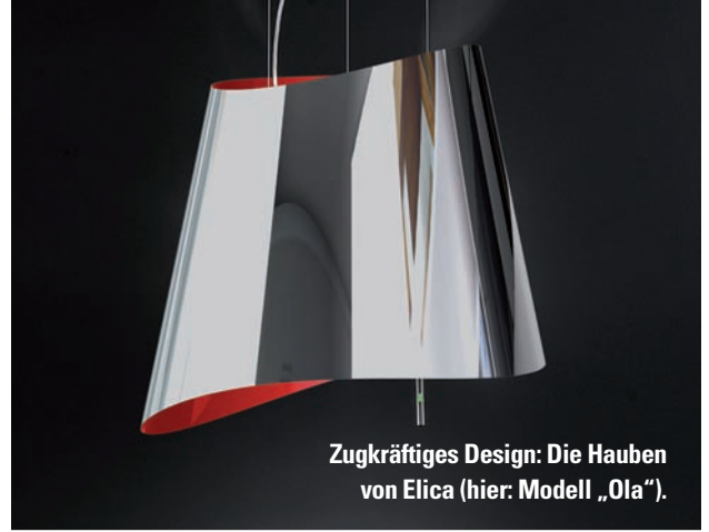
Zugkräftiges Design: Die Hauben von Elica (hier: Modell „Ola“).